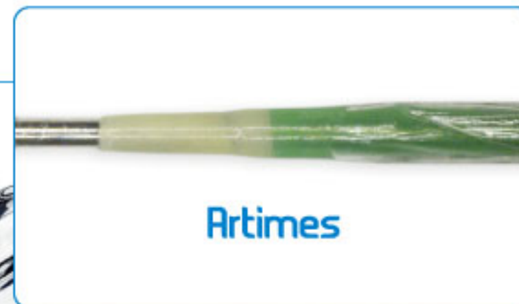
先端チップ拡大写真